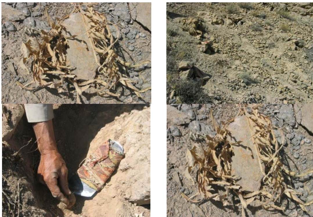
شکل ۲: مرحله علامت گذاری بوته‌ها، پیچاندن، کول کنی و مرحله تیغ زنی و برداشت آنگوزه به ترتیب