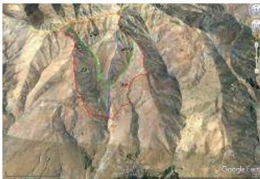
شکل ۳: موقعیت یورت‌های (یورد) مورد بهره‌برداری در مراتع شیوه سور، منطقه مرگور ارومیه