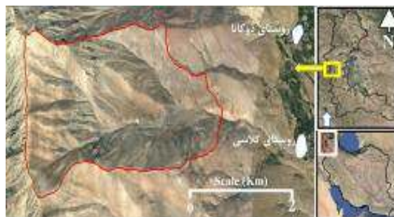
شکل ۱: موقعیت جغرافیایی مراتع شیوه‌سور، منطقه مرگور ارومیه

یورت‌ها، در محدوده زمانی مشخصی از فصل چرا، مورد بهره‌برداری قرار می‌گیرد. سامان عرفی مورد پژوهش، در مجموع دارای چهار یورت (یورد) به نام‌های نزار، نهال، برسی و بروژ است. یورت‌های نهال و نزار، توسط یک بهره‌بردار و یورت‌های برسی و بروژ، توسط بهره‌بردار دیگر، هر ساله به‌طور متناوب، چرا داده می‌شود (شکل ۳ و ۴).