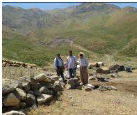
شکل ۴: نمای کلی از مراتع شیوه سور، منطقه مرگور ارومیه