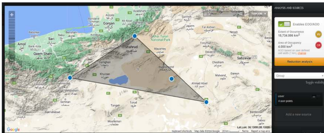
شکل ۳: محدوده حضور و سطح تحت اشغال گونه Hymenocrater oxyodontus در استان سمنان