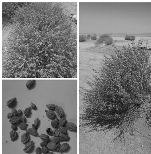
شکل ۱- گونه شمع بیابانی ( Ochradenus ochradeni )

تا 20/4 درصد گزارش کردند. آسکوا و همکاران (۲۰۱۶) ۱ به تعیین کیفیت Soybeans (سویا) با روش NIR پرداختند. که این روش در مطالعه کیفیت آن مفید واقع شد. ارزانی و همکاران (۲۰۱۵) به بررسی میزان (N) و الیاف نامحلول در شوینده اسیدی (ADF) در گرامینه‌های مرتعی در سه مرحله رویشی، گلدهی و بذردهی پرداختند دامنه تغییرات N برای همه نمونه‌ها بین 1/54 و 1/15 و برای ADF برابر 42/14 و 44/72 درصد بود. بالویی و همکاران ۲ (۲۰۱۳) به پیش‌بینی کیفیت علوفه مراتع زیمباوه پرداختند. برای Vigna unguiculata مقدار CP، Ash، NDF و ADF برابر 12/7 ، 8/3 ، 49 و 33/9 به دست آمد. هدف این تحقیق، تعیین کیفیت علوفه گیاه شمع بیابانی برای چرای نشخوارکنندگان به عنوان گیاه ارزشمند منطقه ابرکوه در سه دوره رویشی، بذردهی و خواب گیاه به ترتیب در فصل بهار، تابستان و پائیز و بررسی روند تغییرات کیفیت علوفه و تعیین زمان مناسب چرای دام در مرتع مورد بررسی می‌باشد.