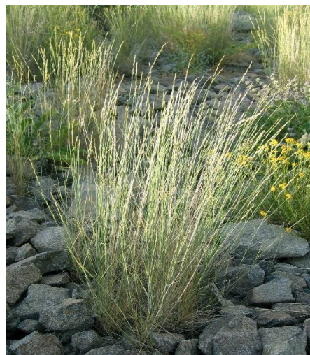
شکل ۲- گیاه Agropyron libanoticum

خوشخوراکی متوسط و طی مراحل رشد از میزان خوشخوراکی آن کاسته شده و کمتر مورد رغبت دام قرار می‌گیرد (۷، ۱۷ و ۲۰).