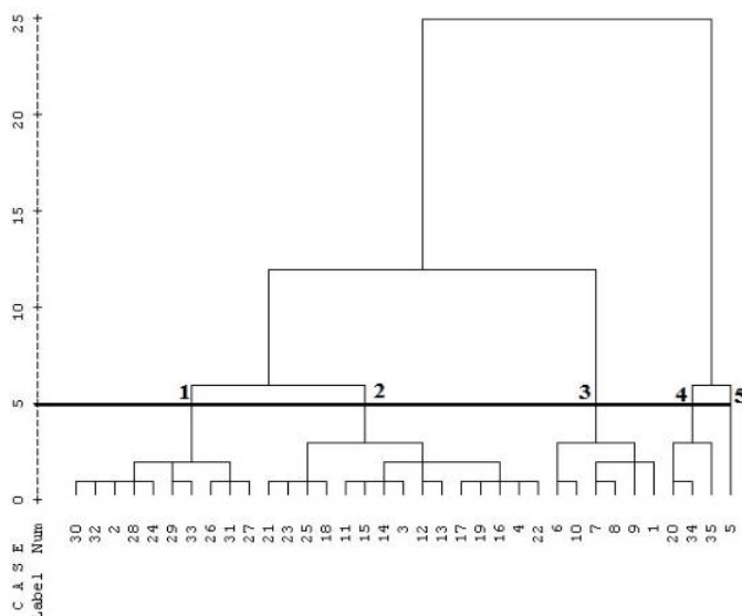
شکل ۳- گروه‌بندی مکان‌ها بر مبنای عوامل اکولوژیکی و تراکم گونه A. libanoticum با استفاده از روش تجزیه خوشه‌ای

* و ** به ترتیب معنی‌دار در سطح احتمال ۵ و ۱ درصد، ns عدم معنی‌داری اختلاف