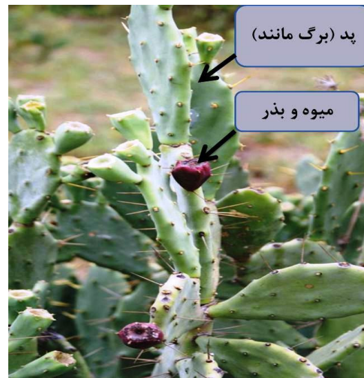
شکل ۱: تصویر شماتیک گیاه O. stricta

آن، می‌تواند گامی در جهت استفاده بهینه از مراتع خشک و شور باشد. شاخص‌های تعیین کیفیت علوفه شامل، ADF، الیاف خام، پروتئین خام و انرژی خام است (۱۵). ارزانی (۲۰۰۹) در تحقیقات خود بیان داشت که چهار شاخص پروتئین، DMD، ME و ADF مهم‌ترین صفات تعیین‌کننده کیفیت علوفه می‌باشد (شکل ۱).