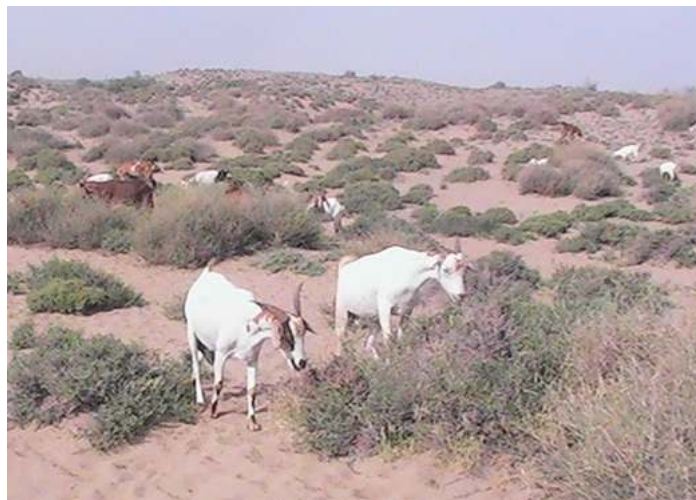
شکل ۳: بز تالی دام غالب منطقه مورد مطالعه