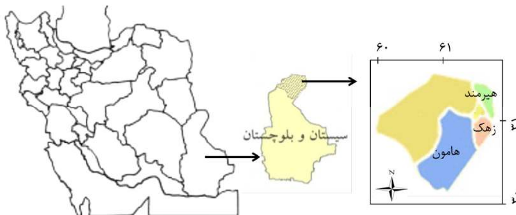
شکل ۱: موقعیت سه رویشگاه مورد مطالعه

ابتدا مناطق پراکنش گونه Capparis spinosa در منطقه سیستان با کمک تجارب کارشناسان مراکز تحقیقات کشاورزی و منابع طبیعی و بازدیدهای صحرایی تعیین گردید. سپس سه رویشگاه معرف انتخاب شد (شکل ۱).