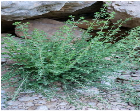
شکل ۳: نمونه آویشن شیرازی در رویشگاه طبیعی در شهرستان داراب