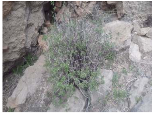
شکل ۲: نمونه آویشن شیرازی در رویشگاه طبیعی در شهرستان داراب