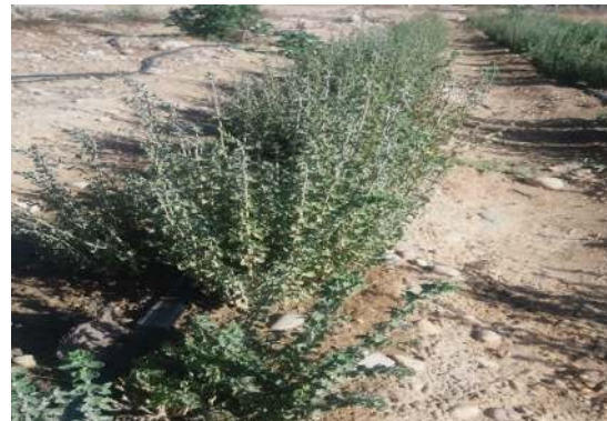
شکل ۶: نمونه زراعی آویشن شیرازی در شهرستان داراب