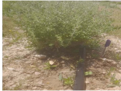
شکل ۴: نمونه زراعی آویشن شیرازی در شهرستان داراب