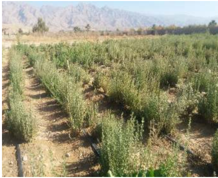
شکل ۵: نمونه زراعی آویشن شیرازی در شهرستان داراب