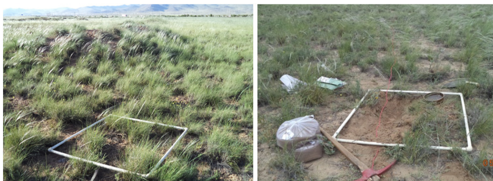
شکل ۲ - نمایی از پوشش گیاهی منطقه و نمونه برداری از خاک و گیاهان

گونه غالب منطقه Stipa hohenackeriana Trin. & Rupr. است (شکل ۲). این گیاه از گندمیان فصل سرد با فرم دسته‌ای است که در مناطق خشک و نیمه‌خشک