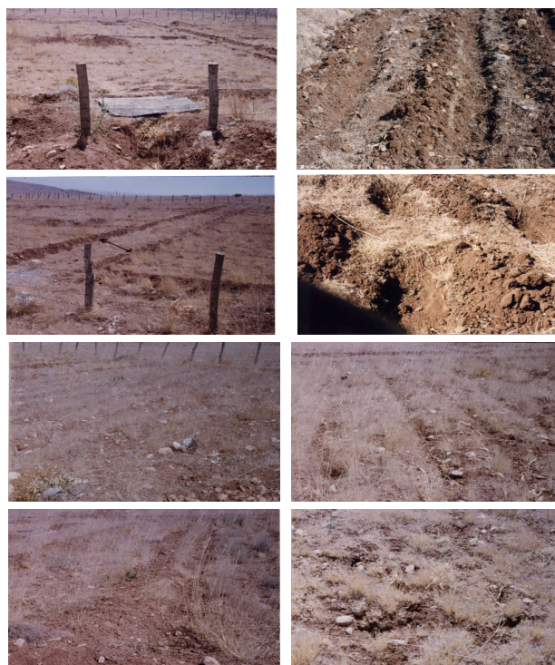
شکل ۲-عملیات پیتینگ و فاروئینگ در منطقه مورد مطالعه قبل و بعد از اجرای طرح

تیمار شاهد: در این تیمار نیز از نظر ابعاد همانند دیگر تیمارها بود ولی هیچ‌گونه عملیاتی در آن صورت نگرفت (شکل ۲).