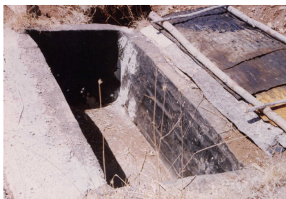
شکل ۳-نمایی از حوضچه رسوبگیر و درپوش فلزی آن

حوزه و مساحت هر کرت، ابعاد حوضچه‌ها محاسبه گردید. با توجه به محاسبات ابعاد حوضچه‌ها به طول ۲ متر، عرض یک متر و عمق ۱ متر تعیین گردید. حوضچه‌ها با سنگ و سیمان احداث و جهت جلوگیری از نفوذ آب حوضچه‌ها به خارج، قیر اندود گردید. همچنین برای جلوگیری از ورود خار و خاشاک و گرد و خاک به داخل حوضچه‌ها، سرپوشی با ورقه فلزی بر روی حوضچه‌ها نصب گردید. در کف حوضچه‌ها لوله‌ای فلزی به قطر ۵ سانتی متر با درپوش فلزی مخصوص جهت خارج نمودن آب و رسوبات حوضچه‌ها، نصب گردید (شکل ۳).