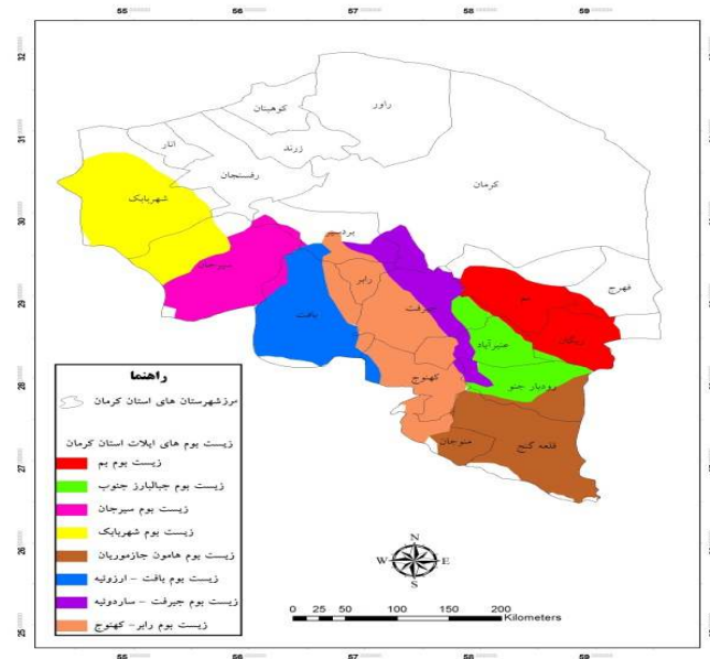
شکل ۱- نقشه زیست بوم‌های عشایر استان کرمان

بین روستاییان می‌گردد. طبیعتاً تولید بیشتر، افزایش بهره‌وری اقتصادی را برای روستاییان (و حتی شهرنشینان) در پی خواهد داشت. مطیعی لنگرودی و همکاران (۲۰۱۱) به بررسی نقش بازارهای دوره‌ای محلی در توسعه اقتصادی - اجتماعی روستاهای استان گیلان پرداختند. نتایج تحقیق آنها حاکی از آن است که بازارهای دوره‌ای محلی در ابعاد اقتصادی، اجتماعی و فرهنگی اثر مثبتی بر توسعه روستاهای مورد مطالعه استان گیلان داشته‌اند. دلیل این امر آن است که در بعد اقتصادی سه مؤلفه، در بعد اجتماعی و فرهنگی دو مؤلفه در بازارهای دوره‌ای وجود دارند که بر توسعه روستایی اثر گذارند و عامل توسعه اقتصادی و اجتماعی در نواحی روستایی مناطق مورد مطالعه می‌شوند. واقعیت آن است که برای ایجاد و دستیابی خانوارهای عشایری به یک معاش پایدار، می‌بایست در ابتدا وضعیت موجود مورد مطالعه و بررسی دقیق قرار گیرد و در این بررسی باید نقطه نظرات و دیدگاه‌های سرپرستان این خانوارها و کارشناسان لحاظ گردد. از سوی دیگر سازه‌هایی که قادرند در معیشت خانوارهای عشایری و در پایداری آن تأثیرگذار باشند، باید شناسایی و مورد مطالعه قرار گیرد. یکی از عواملی که می‌تواند به معیشت پایدار عشایر کمک شایانی کند تشکیل و توسعه بازارهای محلی جهت عرضه