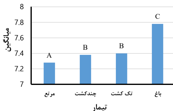
شکل ۷- میانگین اسیدیته در تیمارهای مختلف در لایه تحتانی

نتایج حاصله از تیمار مطلوب و نامطلوب لایه تحتانی در جدول ۴ نشان داده شده است.