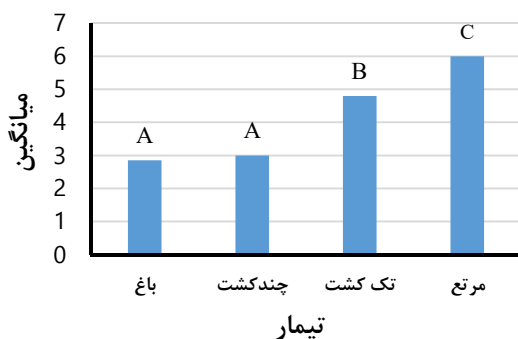
شکل ۶- میانگین شوری در تیمارهای لایه تحتانی

با توجه به شکل ۵، میزان نسبت جذب سدیم در اراضی مرتعی بیشتر از سایر اراضی است و این در حالی است که میزان نسبت جذب سدیم در اراضی باغی کمتر از بقیه است و این نکته نشان می‌دهد که اراضی آبی باغی از لحاظ فاکتور نسبت جذب سدیم کمترین تأثیر تخریبی را در خاک منطقه دارد. که علت آن آبشویی بیشتر نسبت به سایر کاربری‌ها می‌باشد.