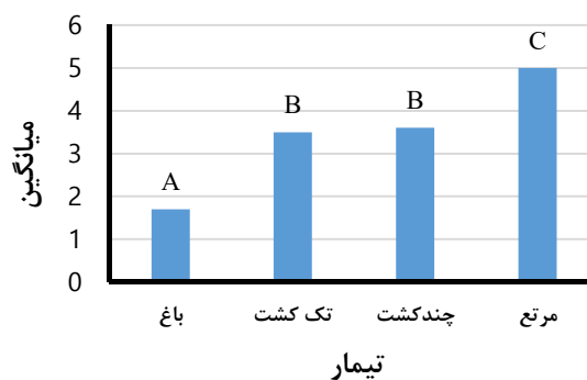
شکل ۵- میانگین نسبت جذب سدیم در تیمارهای لایه تحتانی

شکل ۷ نیز نشان می‌دهد که مقدار میانگین اسیدیته در اراضی مرتعی کمتر از سایر اراضی است و این در حالی است که میزان اسیدیته در اراضی باغی بیشتر از بقیه است و این نکته نشان می‌دهد که اراضی باغی از لحاظ فاکتور اسیدیته بیشترین تأثیر تخریبی را در خاک منطقه دارد.