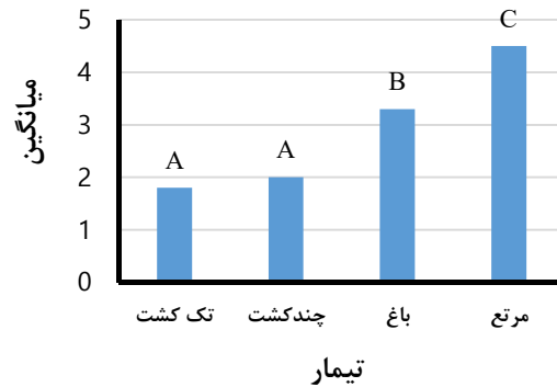
شکل ۲- میانگین نسبت جذب سدیم در تیمارهای لایه سطحی

شکل ۴ نیز نشان می‌دهد که میانگین اسیدیته در اراضی مرتعی کمتر از سایر اراضی است و این در حالی است که میزان اسیدیته در اراضی آبی تک‌کشتی بیشتر از بقیه است و این نکته نشان می‌دهد که اراضی آبی تک‌کشتی از لحاظ فاکتور اسیدیته بیشترین تأثیر تخریبی را در خاک منطقه دارد.