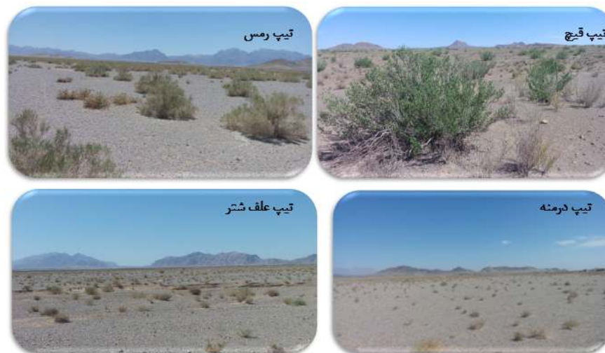
شکل ۲: تیپ‌های مورد مطالعه