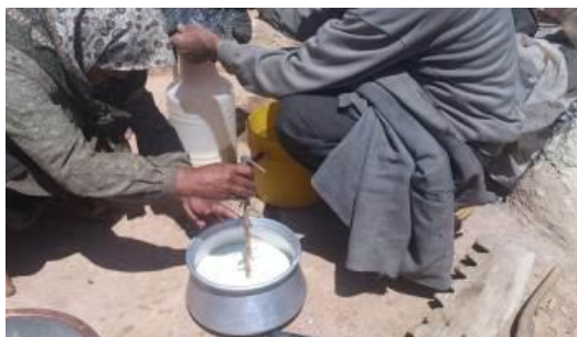
شکل ۱- سوزن زدن در تقسیم‌بندی شیر روزانه در روستای لزور

در فصل شیردوشی طبق سنت و عرف محلی و باتوجه به خلق و خو یک تعاونی سنتی "شیر رفیق" میان دو یا سه نفر از دامداران تشکیل می‌شود. در فصل شیردوشی این رفیقان در کنار هم هستند و هر روز پس از پایان شیردوشی به اندازه‌گیری شیر می‌پردازند. سنجش و اندازه‌گیری شیر روزانه براساس واحدی یکسان صورت می‌گیرد و هر روز پس از پایان شیردوشی براساس تعداد دام و میزان شیر رفیقان، تقسیم‌بندی شیر انجام می‌شود که در اصطلاح محلی و براساس سنت به این عمل "سوزن زدن" می‌گویند (در برخی روستاهای شمال ایران این عمل عیارزنی نام دارد) (شکل ۱).