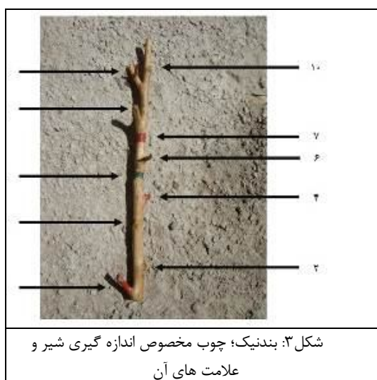
شکل ۳: بندنیک؛ چوب مخصوص اندازه‌گیری شیر و علامت‌های آن