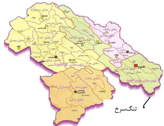
نگاره شماره ۲- نقشه استان کهگیلویه و بویراحمد و موقعیت جغرافیایی منطقه مورد مطالعه: تنگ سرخ

طرح چندمنظوره تنگ سرخ با هدف استمرار و پایداری مرتع و سازمان‌دهی و خروج دام‌های سبک از مرتع در این منطقه اجرا شده است. غنی‌سازی مرتع با کشت گیاهان دارویی همچون آنغوزه صورت گرفته است، از اهداف اصلی منابع طبیعی شهرستان بویراحمد این است که با اصلاح و احیای مرتع به سمت چند گونه‌ای پیش رود تا به پایداری و استمرار مراتع مناطق زاگرس دست یابد. خروج کامل دام‌های سبک از منطقه از دستاوردهای کنونی این طرح می‌باشد که با موفقیت انجام گرفته است. کاشت گیاه دارویی آنغوزه نیز هم‌اکنون در سطح منطقه انجام می‌گیرد.