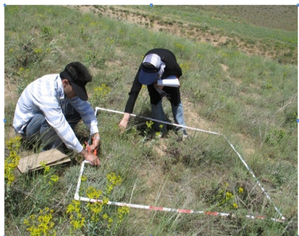
شکل ۲- پلات مورد استفاده در اندازه‌گیری پوشش گیاهی در حوزه زوجی گنبد

ویژگی‌های پوشش سطح خاک بر اساس اندازه‌گیری ۵۳ پلات در سطح زیرحوزه شاهد و نمونه به دست آمد. شاخص‌های آماری تمامی پارامترها نیز برای بررسی بهتر آنها محاسبه گردید که نتایج آنها در جدول (۱) برای زیرحوزه‌های مورد مطالعه آمده است.