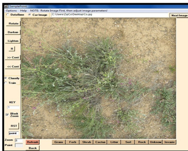
شکل ۲- فراخوانی و طبقه بندی تصاویر در نرم افزار Sample Point