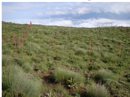
شکل ۱- نمایی از داخل سایت کوهستانی الموت قزوین

مراتع الموت در استان قزوین در فاصله ۱۰۰ کیلومتری شمال شرقی قزوین در محدوده بخش الموت شرقی قرار دارد. دارای اقلیم نیمه‌خشک و خاک نیمه‌عمیق تا کم عمق است. شیوه بهره‌برداری از مراتع روستایی می‌باشد. نوع دام توده‌های آمیخته گوسفند که ۷۰ درصد محلی (توده‌های بومی جثه دام‌های بالغ کوچکتر و چابک برای مناطق کوهستانی است)، ۲۰ درصد فشندی و ۱۰ درصد آن زندی و متفرقه می‌باشد. ترکیب گله به نسبت ۳۰ درصد بز و ۷۰ درصد گوسفند می‌باشد. دوره مرطوب ۷ ماه (آبان، آذر، دی، بهمن، اسفند، فروردین و اردیبهشت) و فصل خشک ۵ ماه می‌باشد. میزان بارندگی میانگین ۳۰ ساله در محل اجرای طرح ۵۸۴/۴ میلی‌متر برآورد شده است. تیپ گیاهی منطقه براساس اندازه‌گیری پلات‌ها در داخل سایت Astragalus و Agropyrum intermedium microcephalus می‌باشد.