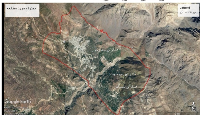
شکل ۱: منطقه مورد مطالعه